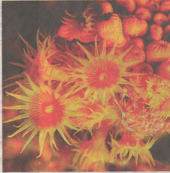
LE CREATURE DEGLI ABISSI Una delle immagini in mostra, opera dello spezzino Leonardo D'Imporzano